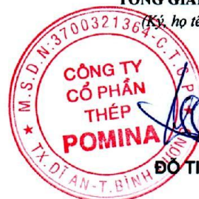
ĐỖ TIẾN SĨ